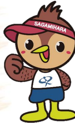
マスコットキャラクター すぽっち

相模原市の更なるスポーツの振興・推進 誰もがスポーツ(する・みる・ささえる)に親しみ健康で豊かに生きることのできる社会づくり