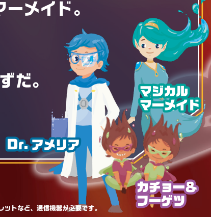
マジカルマーメイド