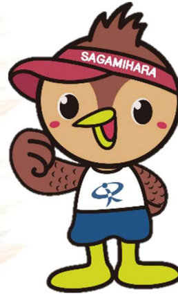
マスコットキャラクター すぼっち

相模原市の更なるスポーツの振興・推進 誰もがスポーツ(する・みる・ささえる)に親しみ健康で豊かに生きることのできる社会づくり