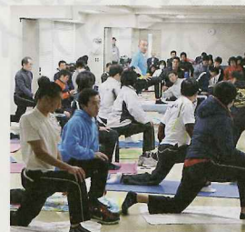
講習会の詳細は決まり次第随時ホームページに掲載いたします。