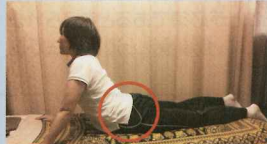
③正面を向いたまま腕を伸ばし、上体を起こします。お腹の下部部分が伸びているか意識しましょう。

★10秒から15秒かけてゆっくりと、姿勢を保って10秒を1セットとしてまずは2セット。 毎日しっかりと実践して下さい。背筋が伸びて腰の重さもすっきりと、きれいな姿勢を保つことが出来ます。猫背も予防できます。