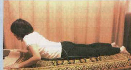
②腕に力を入れてゆっくりと上体を上げていきます。腕は一気に伸ばさないように注意します。