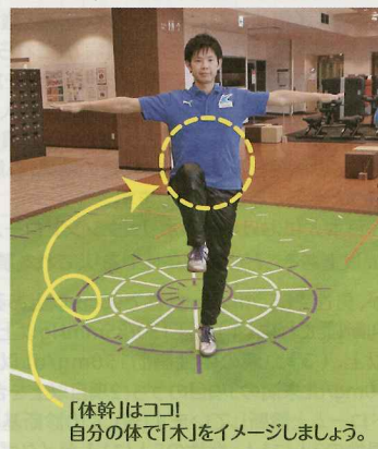
「体幹」はココ！自分の体で「木」をイメージしましょう。

怪我なく無理なく安心・安全にどなたでも出来る体幹メニューはこのゆっくりと行う前後のストレッチとセットになっていることをお忘れなく。