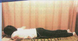
①うつ伏せに寝て肘を曲げて手の平を床につけます。