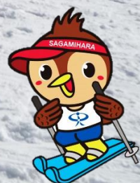
公認マスコット「すぼっち」