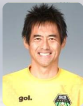
川口 能活 氏 (サッカー) アトランタオリンピック サッカー日本代表